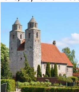
Tveje Merløse Kirke