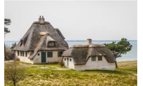
Knud Rasmussens Hus, Hundested