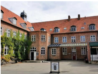
SNS, Psykiatrisk Museum