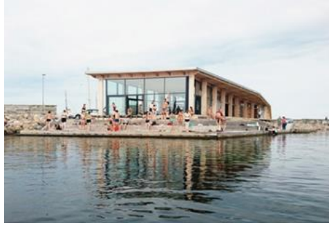
Madpakkehus Røsnæs Havn