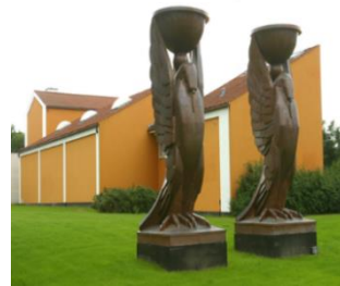
Willumsens Museum, Frederikssund