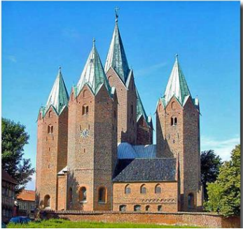
Vor Frue Kirke Kalundborg