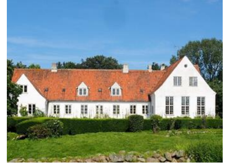
Malergården – Swanemalerne