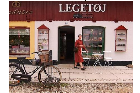
Andels Landsbyen Nyvang