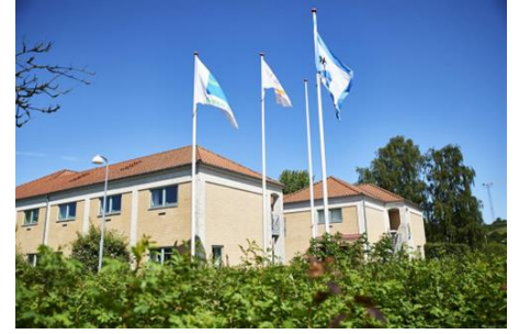
Danhostel Kalundborg – her bor vi.