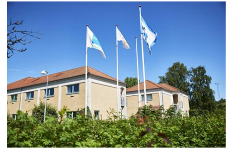
Danhostel Kalundborg – her bor vi.