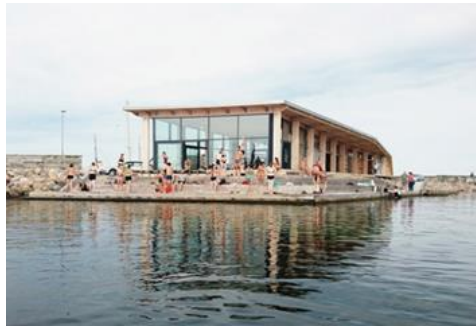
Madpakkehus Røsnæs Havn