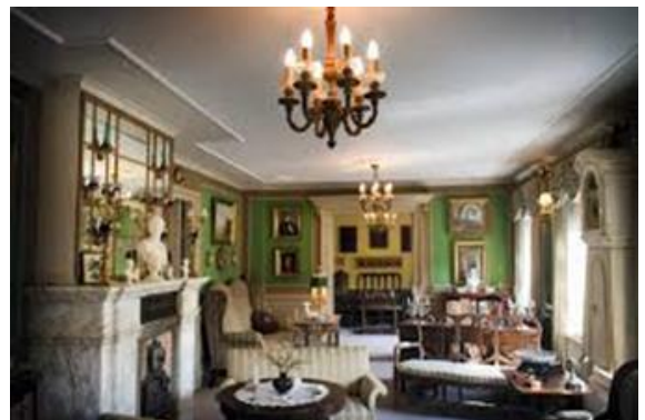
To af stuerne i Ernst Samling.