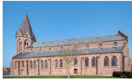
Vor Frue Kirke

Kl. 14.30: Information om og rundvisning i Vor Frue Kirke.