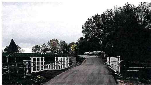
Frihedsbroe v. Kongeåen

på den fint nyistandsatte restaurant på Skibelund Krat Hotel.